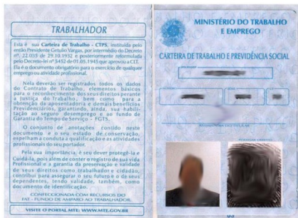
b) Página de qualificação civil: é a página que possui as informações pessoais: